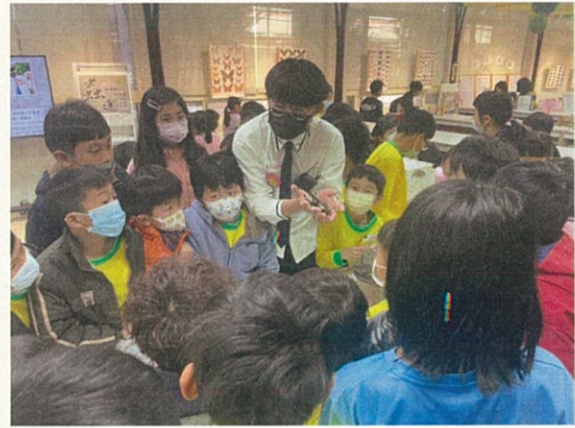
蟲逢昆蟲展~睿恩校友為學弟妹講解昆蟲知識