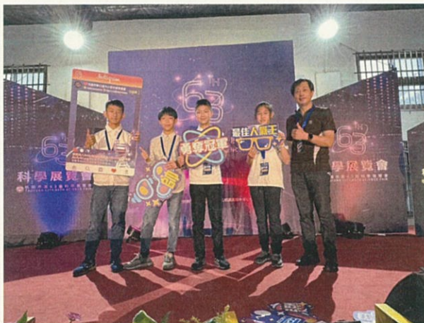
建國龍騎士勇奪桃園市第63屆科展決賽 第一名