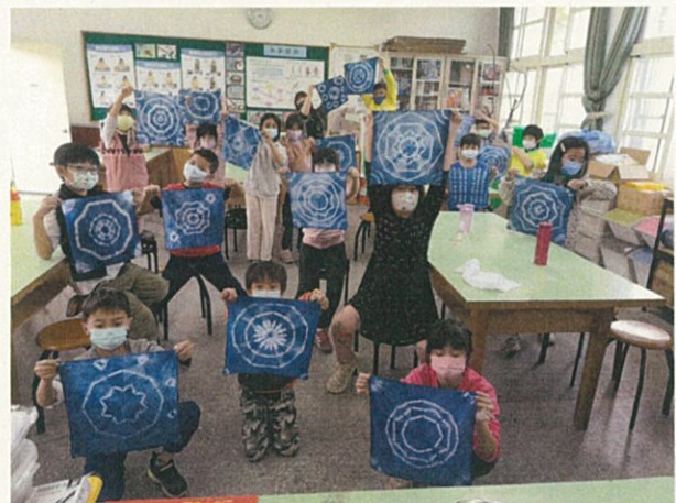
客家生活學校~藍染體驗活動