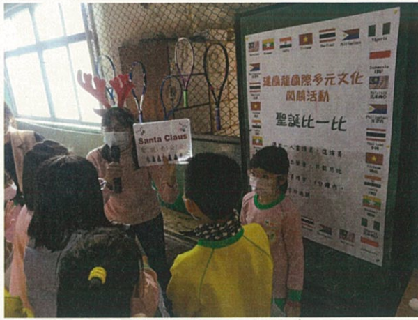
國際多元文化週~闖關活動